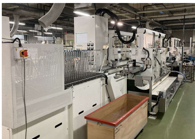
◀ Our automated chamfering line

Our automated processing line, which previously supported glass panel sizes up to 550mm square, has now been upgraded to accommodate 600mm square panels. With modifications to our equipment, we can now perform automated cutting, edge processing, and washing for larger panel sizes, allowing us to better meet the needs of our customers.